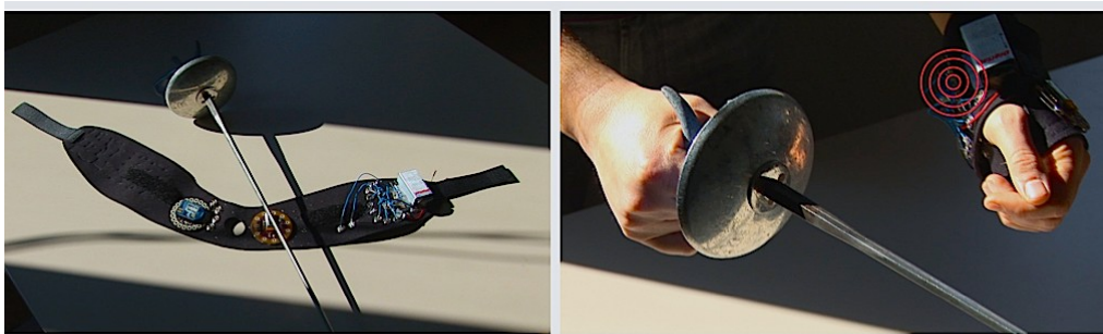
Figura 2: Il nuovo prototipo

È stata poi rilevata la necessità di prevedere la segnalazione per via tattile anche del caso di interruzione dell'assalto disposto dall'arbitro e di conseguenza anche di un diverso segnale per comunicarne l'inizio ("in guardia ... pronti ... a voi!"). Dal punto di vista tecnologico, il primo dispositivo è risultato sufficientemente robusto per sopportare le sollecitazioni tipiche di un assalto in pedana.