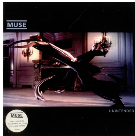
Unintended, 2000 Muse

https://www.youtube.com/watch?v=i9LOFXwPwC4