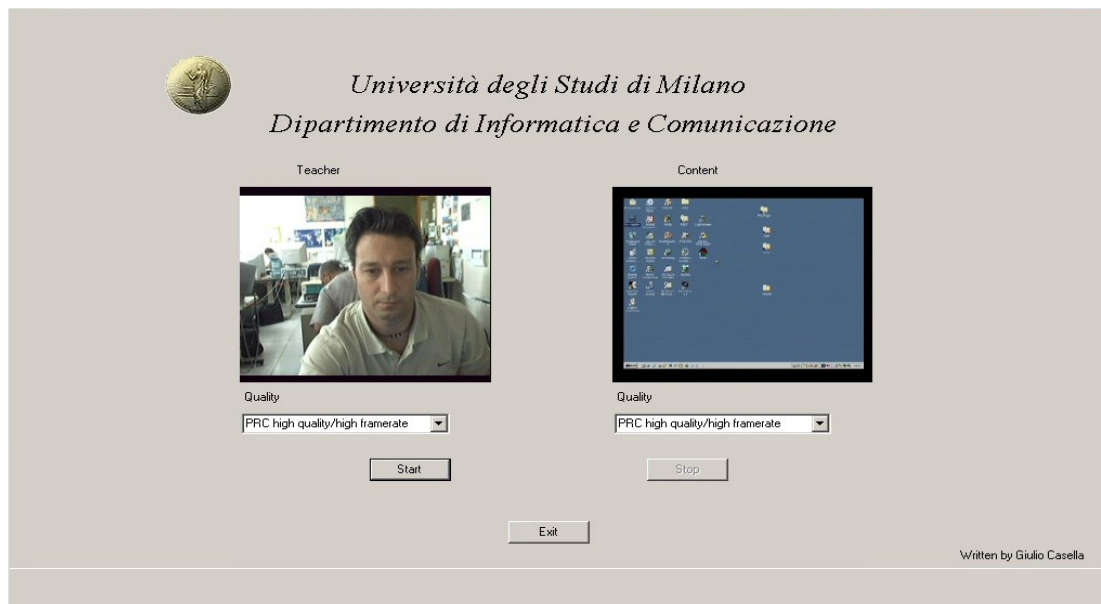
Figura 3. Il display che appare al docente per avviare la registrazione, dopo aver scelto i flussi da archiviare

Un programma ad hoc acquisisce e memorizza i due flussi distinti, quello del materiale e quello della presenza, e in modo diverso. Questo software è scritto in Visual C# e sfrutta il SDK di Windows Media Encoder. I file prodotti sono in formato Windows Media Video (WMV).